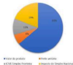
% Custo unitário

Campina Grande – PB, 02 de agosto de 2024.