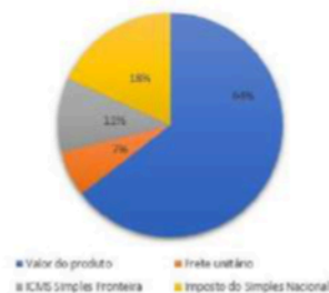
% Custo unitário